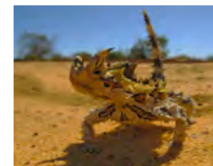
Boven: The Kimberley; daaronder: Windjana Gorge op Gibb River Road; onder: een thorny devil en roze kakatoes ofwel galah