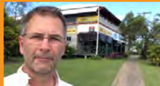
Met dank aan Martien Kooyman, Walkabout Australia & New Zealand