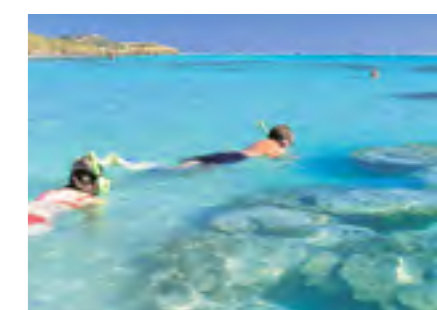
Boven; dolfijnen bij Monkey Mia; onder: snorkelen bij Ningaloo Reef, Coral Bay