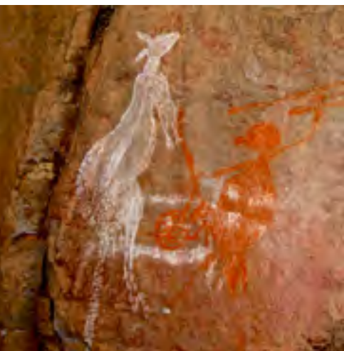
Boven: Kakadu National Park, een zoutwaterkrokodil en een rotstekening van Aboriginals