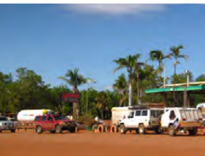
Boven: Gibb River Road; links: Sandfire Roadhouse; rechts: Karijini National Park

Een Australische 4x4 camper is behoorlijk primitief. Geen douche, toilet en de binnenruimte is klein. De ijskast is een veredelde koelbox, eenvoudig keukenblok met klaptafel en bank. Het kookgedeelte is vaak aan de buitenkant uitklapbaar met luifel. Het zijn stevige voertuigen (Toyota Hilux of Landcruiser) met iets minder comfort, dubbele dieseltanks, roo-rack (bullbar) en snorkel.